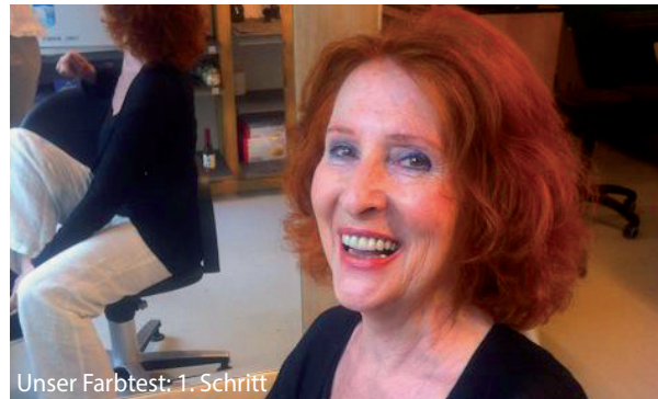
Unser Farbtest: 1. Schritt