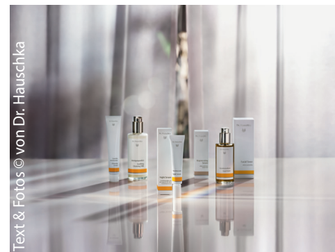
Text & Fotos © von Dr. Hauschka