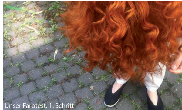
Unser Farbtest: 1. Schritt