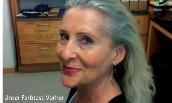
Unser Farbtest: Vorher