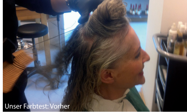
Unser Farbtest: Vorher