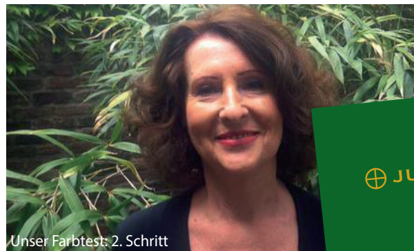
Unser Farbtest: 2. Schritt