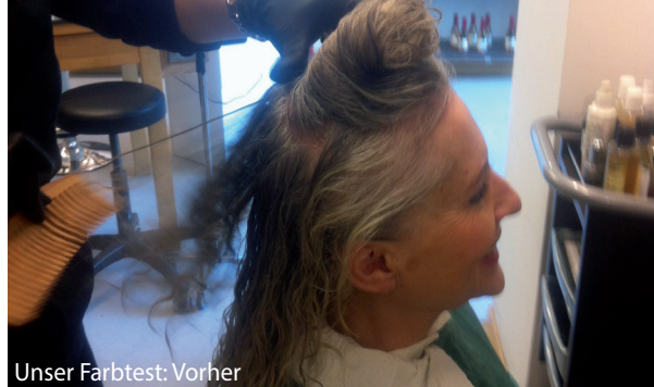
Unser Farbtest: Vorher