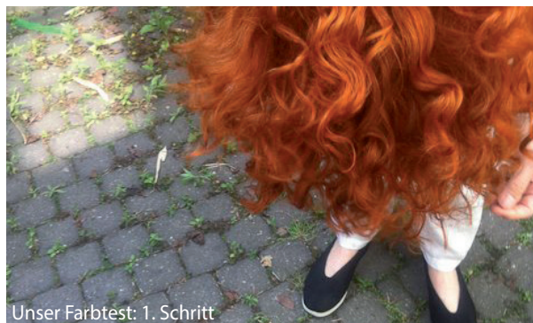
Unser Farbtest: 1. Schritt