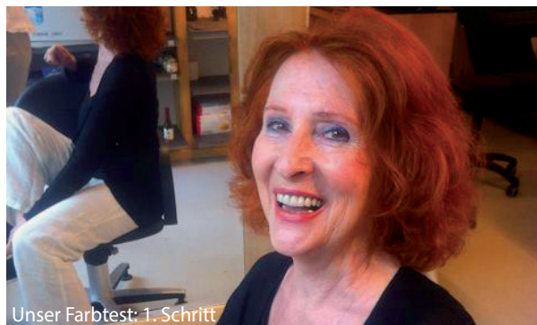
Unser Farbtest: 1. Schritt