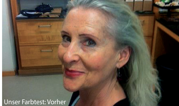
Unser Farbtest: Vorher