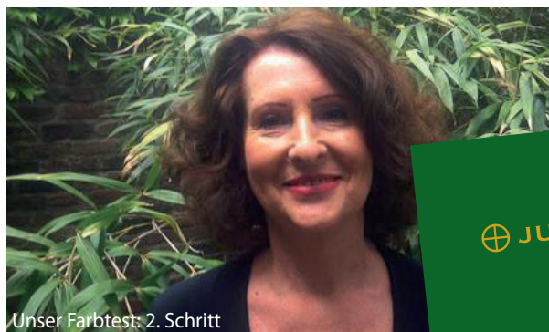
Unser Farbtest: 2. Schritt